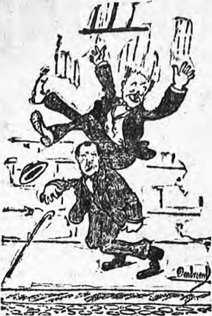
«Konečně jsem narazil na přítele, který mi prokáže dobrou službu.»

I Zemská ovocnářská škola atd. I po stránce finančně-hospodářské poskytuje Slavkovsko dost utěšující obraz. Zvláště nutno zdůraznit, že veškeren zemědělský úvěr je v rukou skutečně solidních ústavů, ať již svépomocných nebo veřejných, a že zadluženost proti dřívějším dobám klesla.