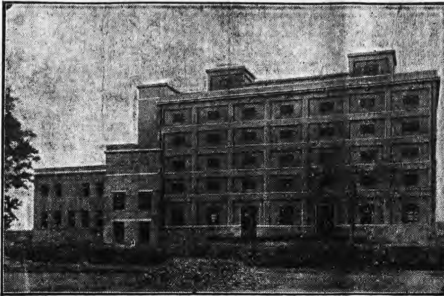
Obilní skladiště Hospod. družstva ve Slavkově.

Snad se pamatujete, že loni na podzim viděli jste na tomto místě obrázek, upomínající na rozestavěný mrakodrap. Holá železobetonová kostra jako klec, téměř bez lešení, rostla a vypínala se vzhůru. Poschodí řadilo se na poschodí, jako když děti si stavějí hrad ze škatulek. Od té doby vyrostla ta hezká klíčka ještě o tři poschodí, oděla se úhlednou fačádou a dnes stojí tam u slavkovského nádraží hotový palác, zápasící s renesančním slavkovským zámekem o čest nejrůznější budovy města.