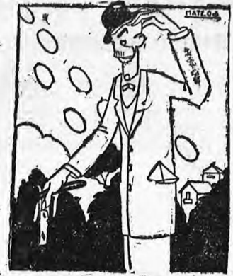
«To je smůla! Zasebevraždím-li se rezavou břítlvou, mohu dostat ještě otravu krve.»

Zuzka a Skorec odcházeli často sami do kovárně a dlouho si vyprávěli. Když pracovali,