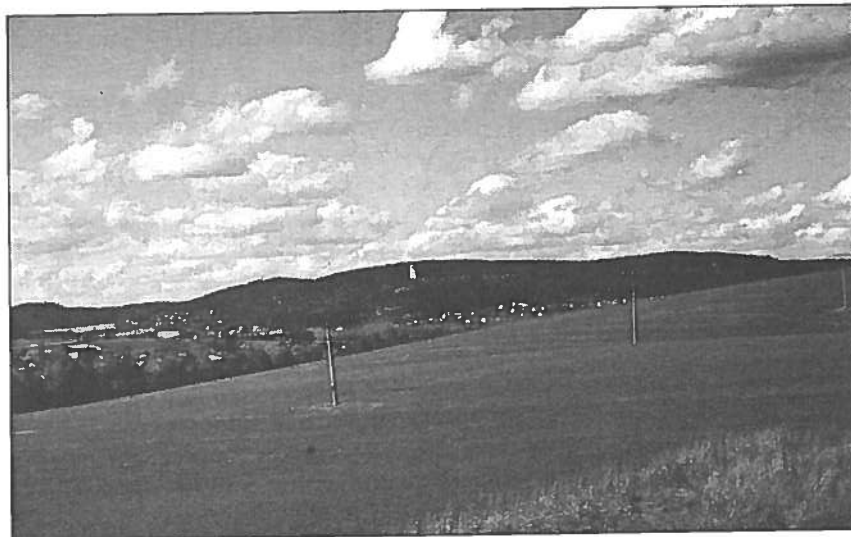
Luleč: Valy - hradisko sv. Martina

Lit.: Beiträge 1982, Plesl - Hrala (red.) 1987. (ks, zs)