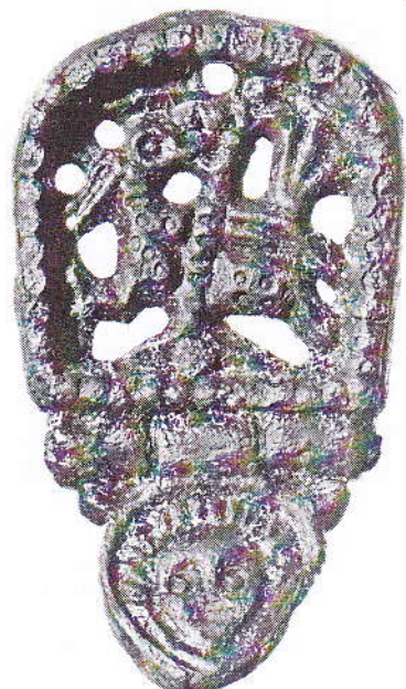
Kování opasku z Kalu (8. století)

MYTICKÁ ZVÍŘATA – vystupovala ve vyprávěních Slovanů v obdobné míře jako u jiných národů a plnila zde různé speciální úlohy. V období avarsko-slovanské symbiózy se zvláštní oblíbeně těšil gryf – čtyřnohé zvíře s křídly a orlím zobákem. Bývá vyobrazen samostatně v loveckých scénách a také v boji s hadem,